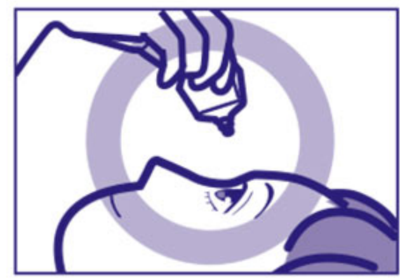
容器の先を下に向けて点眼