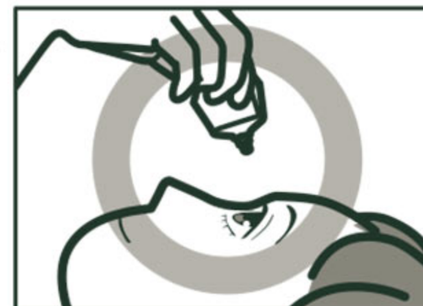
容器の先を下に向けて点眼