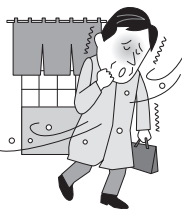
●急激な温度変化や夜ふかし

救心製薬株式会社 東京都杉並区和田一丁目三十二番地 電話 〇三―五三八五―三三二二（代表）