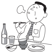
●過度な飲食や肥満

過度な飲食や肥満、喫煙習慣、急激な温度変化や夜ふかしは、心臓に負担をかけ、ごつきや息切れの原因となります。