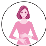
整腸 (便通を整える)